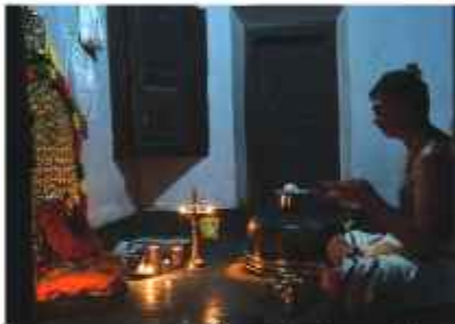
ദേശമംഗലം അവതാറാൻ മനയ്ക്കൽ ഇറക്കിപ്പുള