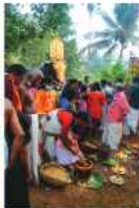
പാഴായി കോണ്ടിൽ അവാട്ടിൽ പര