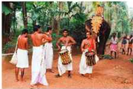
എടക്കുന്നി തെക്കിയിടയടഞ്ഞ് മനയ്ക്കൽ പാ