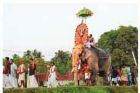
പെരുവനം പൂരം-നാകുളങ്ങരയിൽ നിന്നുള്ള എഴുന്നള്ളിപ്പ്