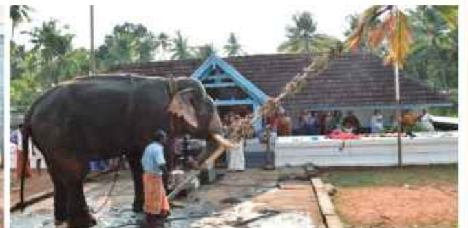
ചാത്തക്കുടം അന്തരം കൊടികുത്തൽ