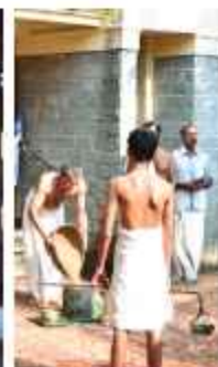
കുഴപ്പിള്ളി മരണിൻ പനി