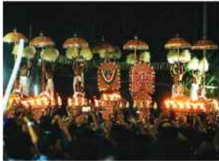
പെരുവനം പുരം ചാത്തക്കുടം ശാസ്താവ് തൊട്ടിപ്പാൾ ഭഗവതി