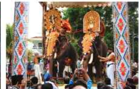
ചാത്തക്കുടം ശാസ്താവും ഉരുകേതമ്മതിരുവടിയും നിലപ്പാട് തറയിൽ