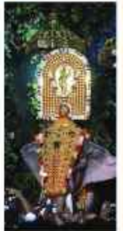
തിലകോട്ടുനമ്പലിൽ ചാത്തക്കുടം ശാസ്താവ്