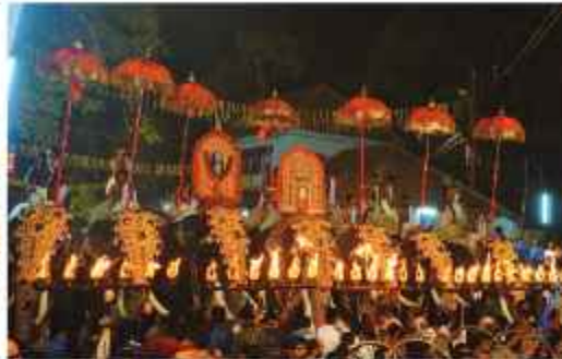
പെരുവനം പുരം ഉരുകേതമ്മതിരുവടി, ചാത്തക്കുടം ശാസ്താവ്