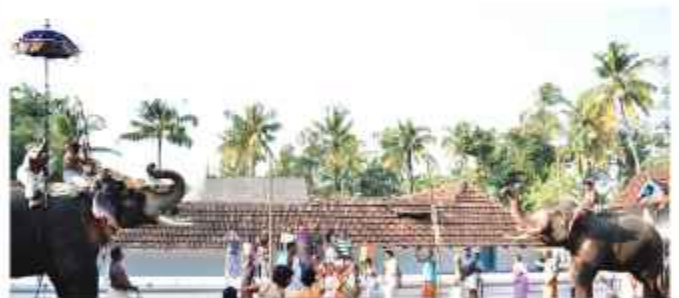
ചാത്തക്കുടം പൂണർത്തം ദേവസ്വംഗമം