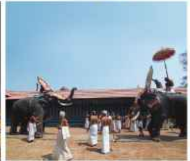
ഉരുകേതമ്മതിരുവടി ചാത്തക്കുടം ശാസ്താവ് ഉപചാരം