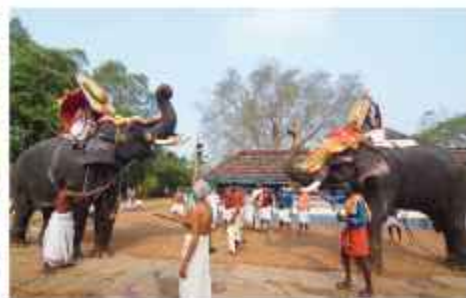
ചാത്തക്കുടം ശാസ്താവും തൊട്ടിപ്പാൾ ഭഗവതിയും ഉപചാരം