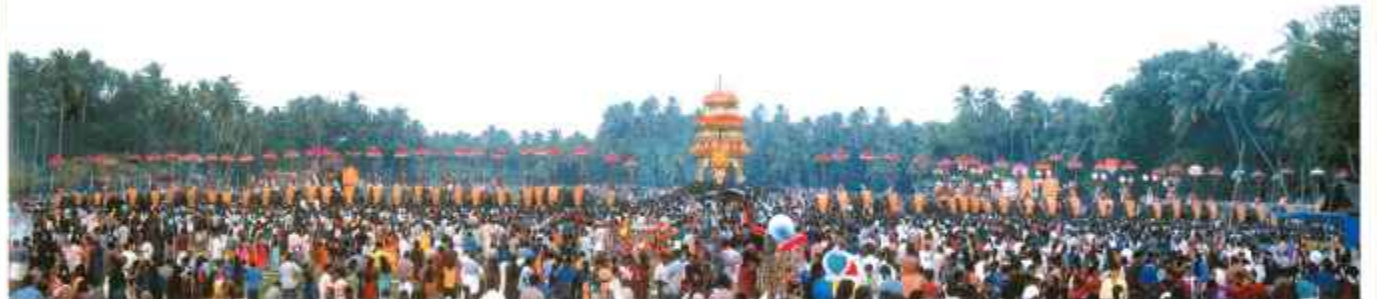
വൈകുണ്ഠാർശനം-കുട്ടിപ്പുഴനുള്ളിൽ (തൃപയാർ തേവർ, ചാത്തക്കുടം ശാസ്താവ്, ഉരകേരത്തുങ്ങിമുഖടി, ചേർപ്പ് ഭഗവതി)