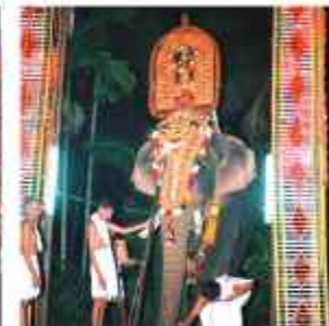
ചാത്തക്കുടം ശാസ്താവ് പീടികപ്പറമ്പ് നിലപ്പാട് തറയിൽ