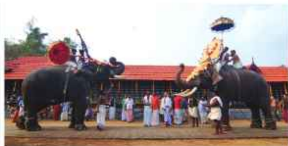
ആറാട്ടുപുഴ പുരം തുടങ്ങുവാൻ ചാത്തക്കുടം ശാസ്താവ് ആറാട്ടുപുഴ ശാസ്താവിന് അനുവാദം നൽകുന്നു.