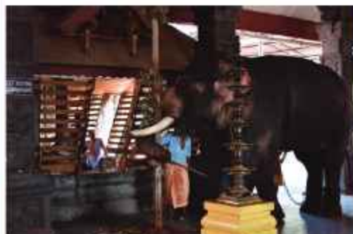
തിരുവല്ലക്കാവ് ക്ഷേത്രം കൊടികുത്തൽ