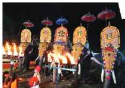
ചക്കംകുളങ്ങര പൂണർത്തം വീളപ്പ്