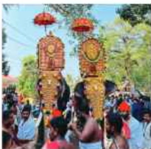
ചാത്തക്കുടം ശാസ്താവും ആറാട്ടുപുഴ ശാസ്താവും തൊട്ടിപ്പാൾ ഇറവഴി പുരം