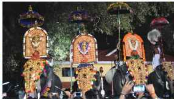
ചാത്തക്കുടം ശാസ്താവ്, ആറട്ടുപുഴ ശാസ്താവ്, എടക്കുണ്ടി ഭഗവതി - പട്ടണിശേഖി