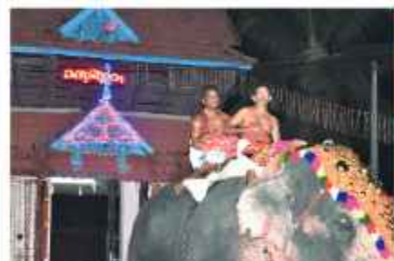
ചാത്തക്കുടം, തിരുവല്ലക്കാവ് ശാസ്താക്കന്മാർ ഒരു ആരാധന