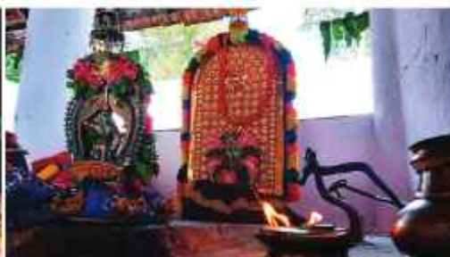
പെരുവനം തൊട്ടുകുളം-ചാത്തക്കുടം ശാസ്താവ് തിരുവല്ലക്കാവ് ശാസ്താവ് അഭയവഴിയ്ക്കി