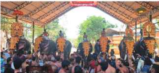
തൈക്കാട്ടുശ്ശേരി പൂരം കൂടി എഴുന്നള്ളിപ്പ്