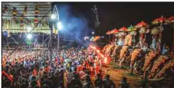
ചാത്തക്കുടം ശാസ്താവിന്റെ പീടികപ്പറമ്പ് പുരം