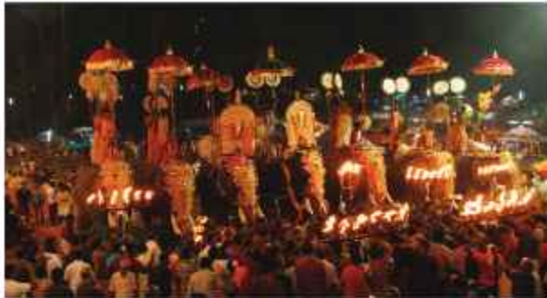
ആറട്ടുപുഴ പൂരം ചാത്തക്കുടം ശാസ്താവ് തൊട്ടിപ്പാൽ ഭഗവതി