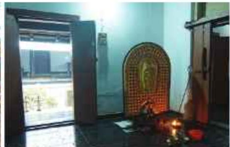
കിഴുപ്പുകര കടലായി നേയിൽ ഇറക്കിപ്പുല